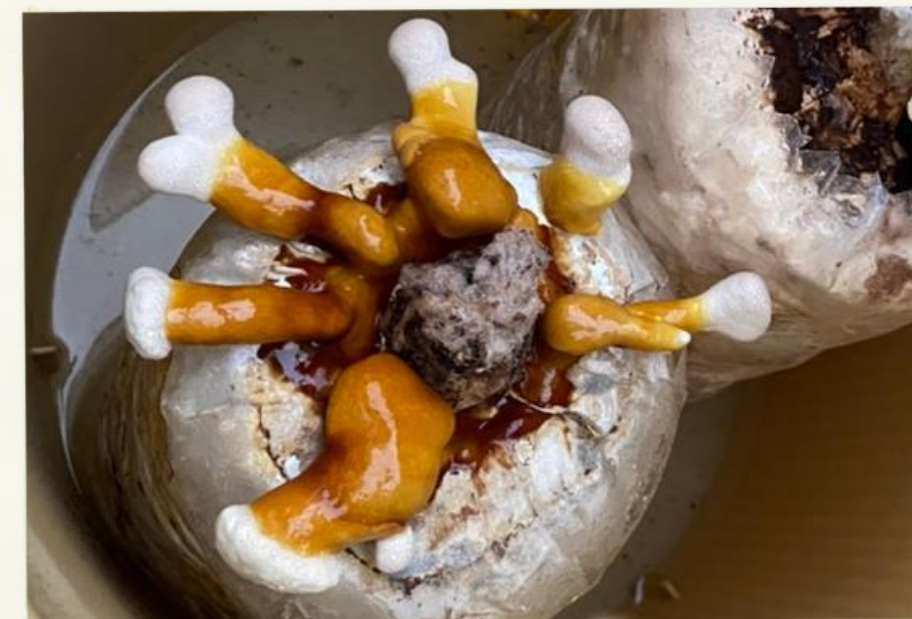
這是我自己種的靈芝