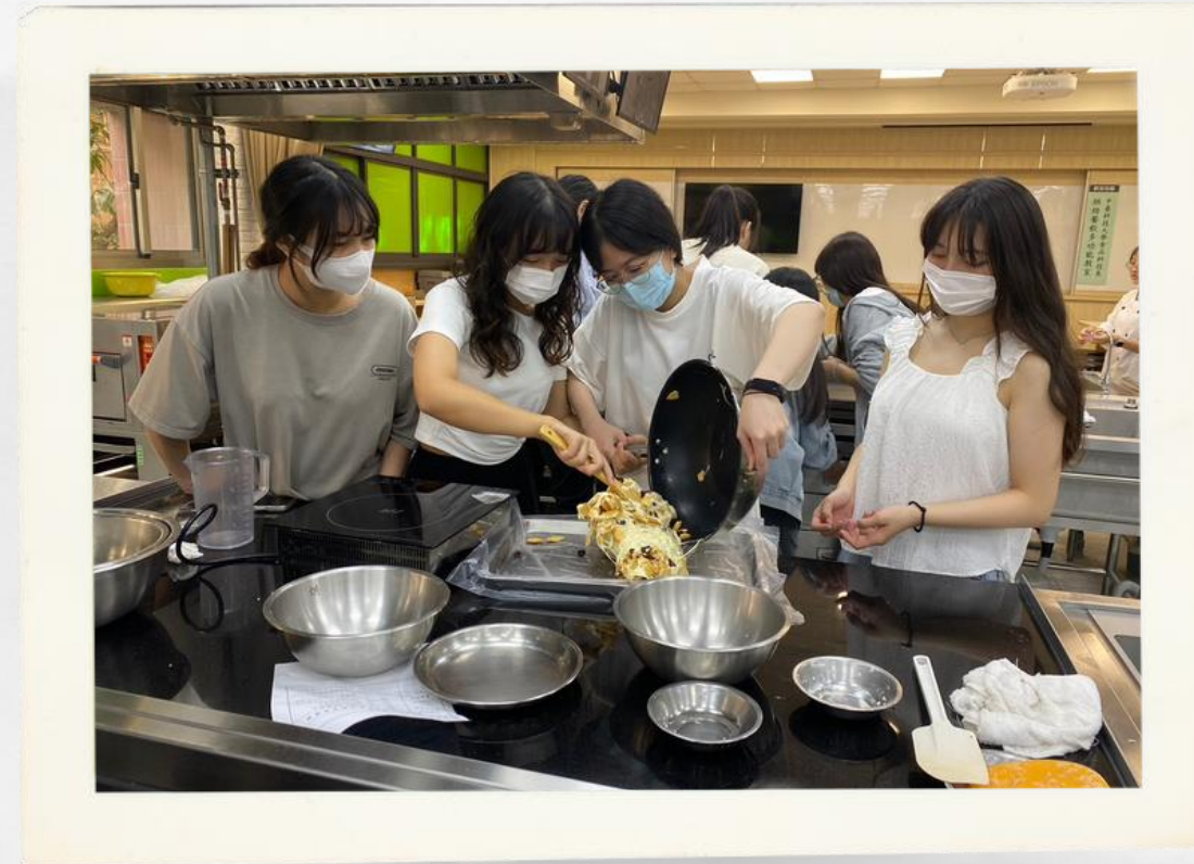
我們分工合作一起攪拌雪Q餅