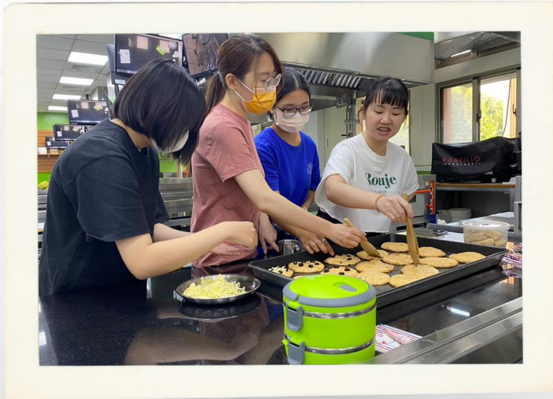
為麵包體塗上蛋液

你也可以放上 標題：課程名稱、副標題：活動內容， 讓大家更清楚這門課在做什麼事情。