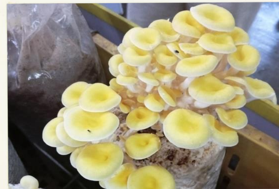
這是珊瑚菇，第一次知道，覺得很新奇