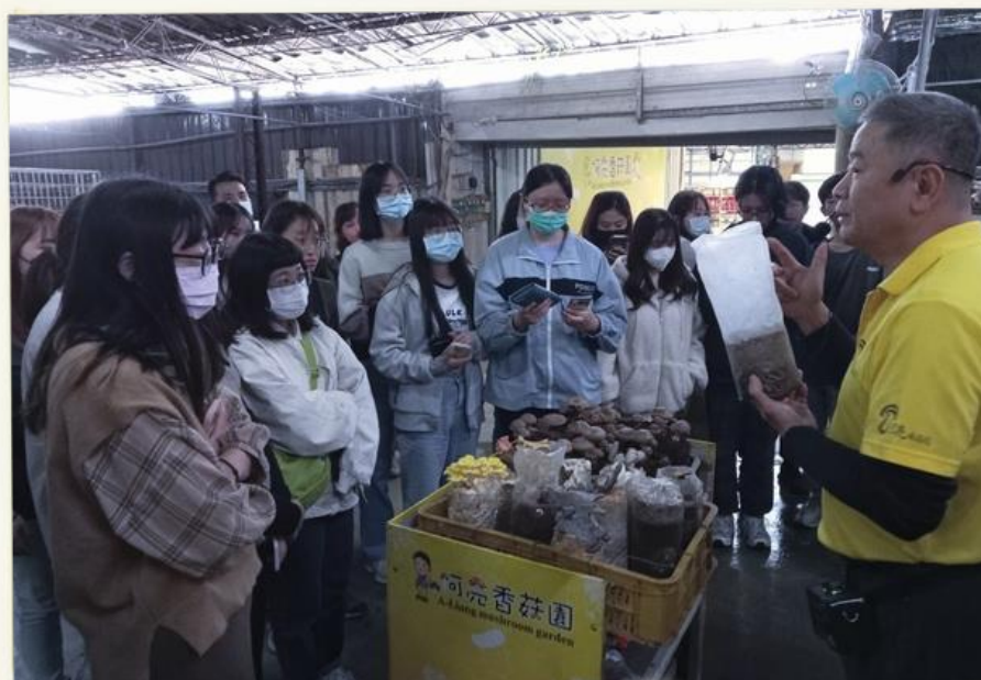
老闆向我們介紹香菇的名稱

老闆很專業地向我們介紹他種的香菇，還送我們一人一個太空包回家種，我每天都很認真觀察我的香菇，很特別的體驗。